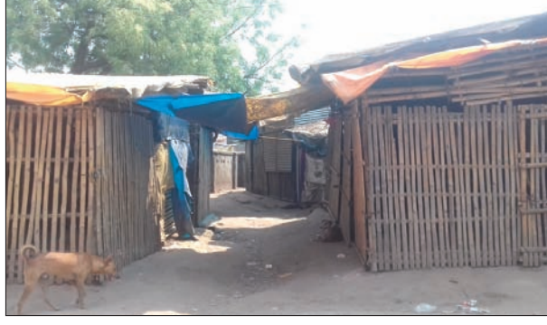
इन झोपड़ियों के अंदर शराब की बिक्री होती है।

आदित्यपुर, 4 अप्रैल (रिपोर्टर) : कोरोना वायरस की वजह से एक ओर जहां पूरे देश में लॉकडाउन का माहौल है। वहीं दूसरी ओर इस अवधि में भी आदित्यपुर थाना क्षेत्र में अवैध महुआ शराब की धड़ले से बिक्री की जा रही है, जिसकी वजह से स्थानीय लोगों को काफी परेशानी झेलनी पड़ रही है। जानकारी के अनुसार, वैश्विक महामारी कोरोना की वजह से घोषित लॉकडाउन के बावजूद आदित्यपुर थाने से सटे