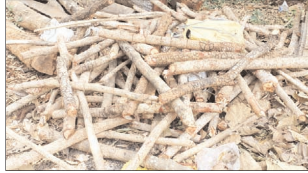
खरसावां के सिदमाकुदर जंगल से छापामारी कर जब्त की गई कच्चा लकड़ी.