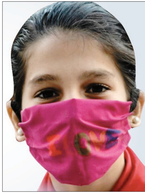
से छूने से बचाएगा.

घर से निकलने वालों को मास्क लगाना जल्दी : अग्रवाल ने बताया कि घर से बाहर निकलने वाले सभी लोगों के लिए मास्क लगाना जल्दी है. लोग घर में तैयार मास्क का भी प्रयोग कर सकते हैं. जल्दी नहीं है कि सभी लोग मेडिकल कर्मचारियों और डॉक्टरों के लिए उपयोग किए जाने वाले एन-93 मास्क का ही प्रयोग करें. घर में बना मास्क हमें धूल-मिट्टी के साथ मुंह और नाक को हाथ