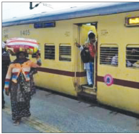
चरणबद्ध योजना के लिए सुझाव दिया जाना चाहिए। रेल मंत्री पीयूष गोयल की रेलवे बोर्ड के चेयरमैन के साथ शुरुवार को वीडियो कॉन्फ्रेंस बैठक में यह फैसला लिया गया। ट्रेनों का संचालन सरकार से हरी

ट्रेनों का संचालन सरकार से हरी झंडी मिलने के बाद ही शुरू होगा : एक अधिकारी ने शनिवार को बताया, रेलवे बोर्ड से हर ट्रेन को मंजूरी मिलने पर ही ट्रेन सेवाएं बहाल की जाएंगी। रेलवे बोर्ड को