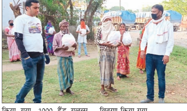
किया गया। 1000 हंडू ग्लब्स, सैनीटाइजर, मास्क एवं साबुन का वितरण किया गया। गोविंदपुर में बाहर से आने

जमशेदपुर, 4 अप्रैल (रिपोर्टर) : युवा कांग्रेस की ओर से गोविंदपुर के विभिन्न क्षेत्रों जहां गरीब तबकों के बीच लगभग 350 परिवार को राशन वितरण किया गया। बर्मागाईस में गांधी आश्रम में लगभग 50 लोगों के बीच राशन दिया गया। 300 लोगों का भोजन की व्यवस्था बगदरारी मे गरीबो के बीच की गई। लोक डाउन में ड्यूटी पर तैनात पुलिस कर्मियों के बीच खाद्य सामग्री एवं शीतल पेय पदार्थ का वितरण