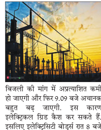
बिजली की मांग में अप्रत्याशित कमी हो जाएगी और फिर 9.09 बजे अचानक बहुत बढ़ जाएगी। इस कारण इलेक्ट्रिकल ग्रिड क्रेश कर सकते हैं। इसलिए इलेक्ट्रिसिटी बोर्ड्स रात 8 बजे से ही बिजली काटने और 9.09 बजे वापस देने की सोच रहे हैं। थरु ने पीएम पर तंज कसते हुए लिखा, 'प्रधानमंत्री (शेष पेज दो पर)

नई दिल्ली, 4 अप्रैल (ईएमएस): पीएम मोदी ने 5 अप्रैल को रात 9 बजे से 9 मिनट तक घर की लाइट बंद करने की अपील की है। उन्होंने दीया, मोमबत्ती, टॉच या मोबाइल की सेल्फी ऑन करने की अपील की है, ताकि कोरोनावायरस को हराने की देश की एकता और मजबूत हो। पीएम ने कहा कि ऐसा करने से संदेश जाएगा कि कोरोना के खिलाफ लड़ाई में हम अकेले नहीं हैं। सभी साथ हैं। अब सोशल मीडिया पर दावा किया जा रहा है कि एक साथ लाइट बंद करने से इलेक्ट्रिकल ग्रिड क्रेश हो सकती है। कांग्रेस के सांसद शशि थरु ने उत्तर प्रदेश के पावर ट्रांसमिशन कॉर्पोरेशन लिमिटेड की एक चिट्ठी शेयर करते हुए लिखा, 'रविवार रात 9 बजे रात में बिजली की मांग में अप्रत्याशित कमी हो जाएगी और फिर 9.09 बजे अचानक बहुत बढ़ जाएगी। इस कारण इलेक्ट्रिकल ग्रिड क्रेश कर सकते हैं। इसलिए इलेक्ट्रिसिटी बोर्ड्स रात 8 बजे से ही बिजली काटने और 9.09 बजे वापस देने की सोच रहे हैं। थरु ने पीएम पर तंज कसते हुए लिखा, 'प्रधानमंत्री (शेष पेज दो पर)