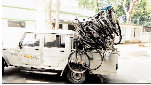
खरसावां के सिदमाकुदर जंगल से छापामारी कर जब्त की गई साइकिलें, खरसावां के सिदमाकुदर जंगल से छापामारी कर जब्त की गई कच्चा लकड़ी.

खरसावां,04 अप्रैल, संवाददाता: खरसावां के सिदमाकुदर जंगल में वन विभाग और वन समिति के द्वारा शनिवार को संयुक्त छापामारी कर जंगल की अवैध कटाई कर साइकिल में ले जाने वाले ११ साइकिल, चार कुल्हाड़ी, एक दावली सहित एक कुंटल कच्चा लकड़ी जब्त किया गया. मिली जानकारी के अनुसार विगत चार दिनों से सीनो विद्यापुर के रास्ते अज्ञात साइकिल सवार सिदमाकुदर जंगल में गतिविधि बढ़ गई थी. साइकिल से अज्ञात लोग सिदमाकुदर जंगल पहुंचकर जलवन के नाम पर छोटे-छोटे पेड़ों को कटाई कर साइकिल से ले जा रहे थे. वन समिति सिदमाकुदर के लोगों ने उसे रोका. जिसके बाद ग्रामीणों और वन समिति के सदस्यों के साथ अज्ञात लोगों की नोकझोंक भी हुई. इसके बावजूद अज्ञात लोग छोटे-छोटे पेड़ों को कटाई करने में बाज नहीं आ रहे थे. अतः में