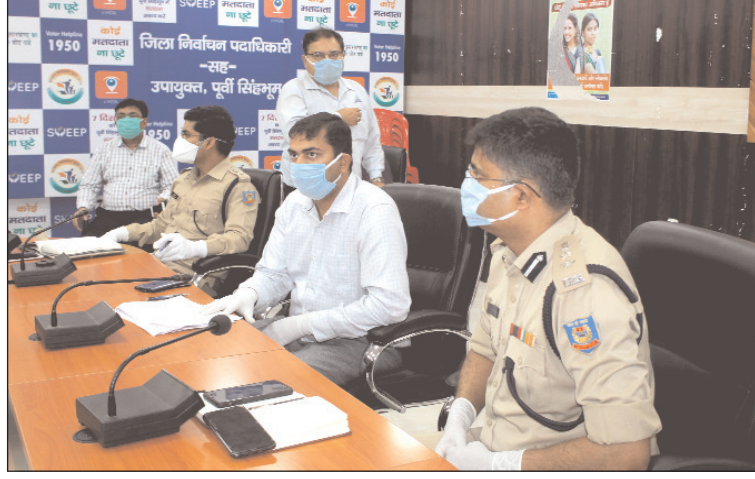
भोजन बांटने को सेक्टर हिसाब से निगित होगा पास

कहा कि जिले के बाहर से आनेवाले मजदूर को या तो शहर में ही रहने की व्यवस्था करें अथवा उनके स्थान पर स्थानीय मजदूरों से काम कराएं। उन्होंने कंपनी पदाधिकारी को निर्देश दिए कि अपने सूत्रों एवं संसाधन के माध्यम से डोर टू डोर सर्वे कराएं एवं लोगों को कोरोना वायरस के प्रति जागरूक करने में जिला प्रशासन का सहयोग करें। जुस्को को लोगों को जागरूक करने के लिए माइकिंग कराने के साथ ही लगातार फॉर्गिंग कराने का भी निर्देश दिया।