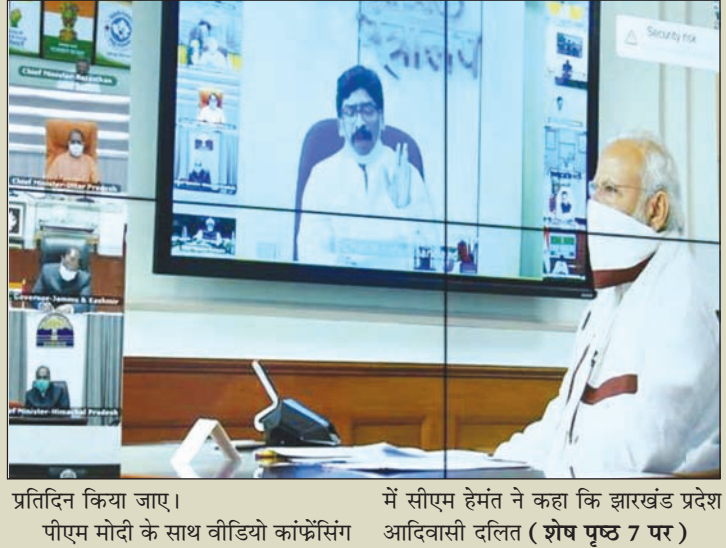
प्रतिदिन किया जाए।

रांची, 11 अप्रैल ईएमएस : मुख्यमंत्री हेमंत सोरेन ने शनिवार को प्रधानमंत्री नरेंद्र मोदी के साथ वीडियो कॉन्फ्रेंसिंग में हिस्सा लिया। पीएम मोदी के साथ बातचीत में सीएम हेमंत सोरेन ने कहा है कि लॉकडाउन से काफी परेशानी हो रही है। लॉकडाउन समाप्त होने के बाद भी दिक्कतें कम नहीं होंगी। सीएम ने पीएम के सामने कोरोना वायरस से लड़ने के लिए अपनी मांगें भी रखीं। कहा कि राजस्व के तमाम स्रोत बंद हैं। इसलिए केंद्र सरकार धुगतान करे। मनरेगा के तहत मजदूरी दर बढ़कर न्यूनतम 300 रुपये